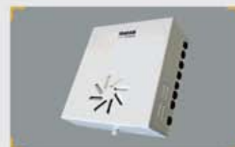
Unidad de Control Principal (UCP)

Centraliza las señales de entrada-salida de todos los componentes. Se comunica con el Equipo de Aire, interviniendo en su funcionamiento. Proporciona la tensión de trabajo (24 Vca) de todo el sistema. Hasta 6 zonas. La Zona 1 es doble, pudiendo controlar dos UTM. La Unidad Principal es siempre necesaria, para cualquier número de ambientes.