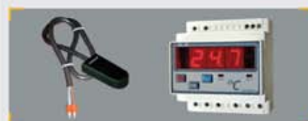
Termostatos de Seguridad (TRS): TRS-T y TRS-D

Instalado en el conducto de descarga del Equipo de Aire Acondicionado, mide la temperatura del aire de impulsión. Es un termostato doble. Tarado con los valores de temperatura correspondientes, evita que la máquina trabaje fuera de los valores convenientes. Se dispone de dos modelos: Termoeléctrico y Digital.