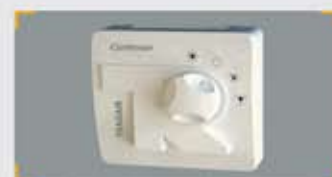
Selector de Modo de Funcionamiento (SMF)

A través de este mando se ordena a la Unidad Principal el modo de trabajo que ha de adoptar el Equipo de Aire. Simultáneamente, se prepara el sistema para que la acción de las compuertas de las zonas sea la adecuada. Se conecta a la UCP. Hay cuatro modos: Calor, frío, ventilación y espera.