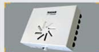
Unidad de Control Secundaria (UCS)

Esta Unidad es un complemento a la Principal, que permite añadir hasta 6 zonas más (de la 7 a la 12). Las Unidades de Control intercambian información sobre el estado de las zonas. Controla una UTM por cada ambiente.