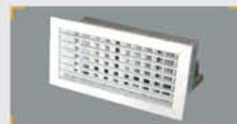
Unidad Terminal Motorizada (UTM)

Son los elementos de difusión de aire que climatizan las zonas: rejillas y difusores (con compuerta motorizada), incluso (si es el caso) las compuertas motorizadas intercaladas en conducto. En función de las indicaciones de los TRZ, reciben señales desde las Unidades de Control, ajustando la aportación de aire. Las zonas trabajan, así, a caudal variable.