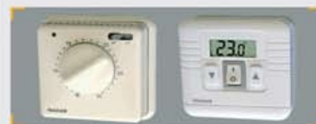
Termostatos de Zona (TRZ): TRZ-A y TRZ-D

Situados en cada local, se encargan de medir la temperatura ambiente, comparándola con la fijada por el usuario. Al coincidir con ésta, generan una señal, comunicando su estado a las Unidades de Control. Se dispone de dos modelos: Analógico y Digital.