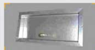
Compuerta de "By-Pass" (CBP)

Su misión es controlar el efecto generado por las variaciones de caudal que se producen en las zonas (cuando las compuertas abren y cierran), evitando una elevación de la presión estática en la red de conductos. La compuerta es de sobrepresión, no motorizada. Su apertura, de amplitud variable, devuelve el exceso de caudal, recirculándolo, a la Máquina de Aire.